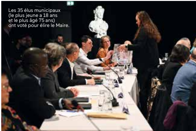
Les 35 élus municipaux (le plus jeune a 18 ans et le plus âgé 75 ans) ont voté pour élire le Maire.

Le dimanche 29 mars, a eu lieu, un temps fort de la vie démocratique municipale au cœur de La Ferme de Bel Ébat puisque s'est tenue la réunion du premier conseil municipal nouvellement élu. Retour en images sur ce moment riche de symboles et fort en émotions.