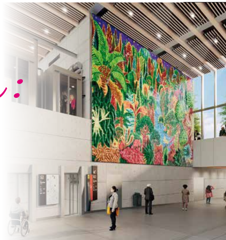
© Hervé Di Rosa - ADAGP / Dietmar Feichtinger Architectes / Société des grands projets