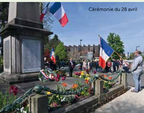
Cérémonie du 28 avril