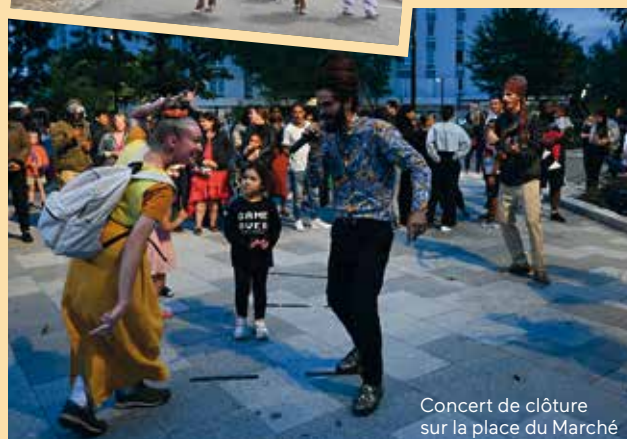
Concert de clôture sur la place du Marché