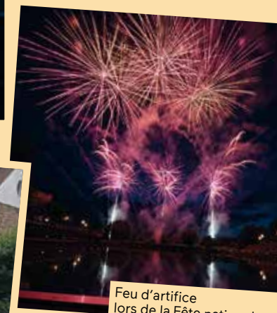
Feu d'artifice lors de la Fête nationale