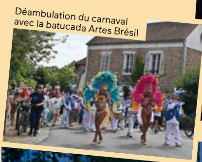
Déambulation du carnaval avec la batucada Artes Brésil