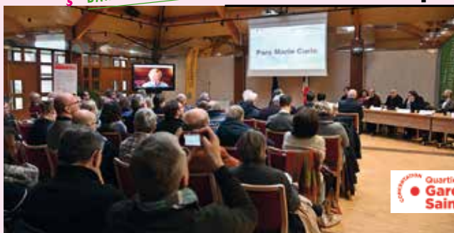
Quartier des Savoirs Gare Guyancourt Saint-Quentin

L'an passé, plus d'une centaine de Guyancourtois se sont connectés sur la page Facebook de la Ville pour échanger en direct avec le Maire, François Morton. Plusieurs invités avaient été conviés pour présenter leur activité et répondre aux questions des habitants. Parmi eux, des représentants d'associations locales (CIDFF, Sauvegarde des Yvelines) et de services publics (Police Nationale, Institut de Promotion de la Santé et Société du Grand Paris). Rendez-vous le 15 janvier à 18 h pour le prochain Facebook live.