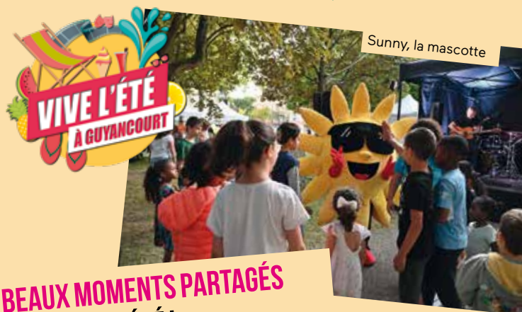
Sunny, la mascotte

Retrouvez plus de photos sur ville-guyancourt.fr en flashant ce code