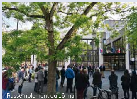
Rassemblement du 16 mai

Le 11 mars dernier, lors de la journée nationale d'hommage aux victimes du terrorisme, élus et habitants étaient réunis sur le parvis de l'Hôtel de Ville pour saluer les femmes et les hommes, parmi lesquels des Guyancourtois, qui avaient été visés par des attaques. Huit mois plus tard, à l'appel du Maire, François Morton, un rassemblement républicain avait lieu en hommage aux professeurs, Dominique Bernard, assassiné vendredi 13 octobre dans un lycée à Arras et Samuel Paty, assassiné 3 ans plus tôt dans un collège à Conflans-Sainte-Honorine. De même, lorsque, dans un autre contexte, des attaques criminelles ont été portées à des Maires de France, la Ville a, là aussi, tenu à organiser des rassemblements pour rappeler les valeurs de la République : le 16 mai dernier, en soutien à Yannick Morez, Maire de Saint-Brévin, visé par des groupes d'extrême droite et le 3 juillet, en soutien à Vincent Jeanbrun, Maire de L'Haÿ-les-Roses, après l'attaque de son domicile à la voiture-bélier.