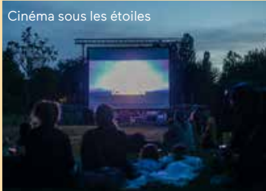
Cinéma sous les étoiles