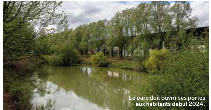
Le parc doit ouvrir ses portes aux habitants début 2024.