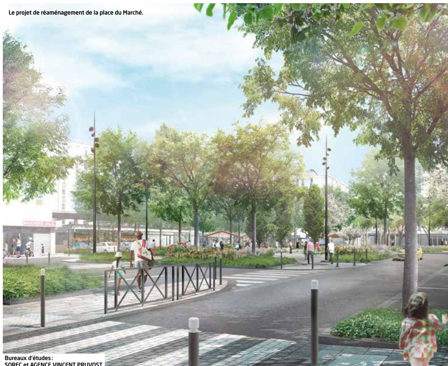
Le projet de réaménagement de la place du Marché.

Bureaux d'études : SOREC et AGENCE VINCENT PRUVOST