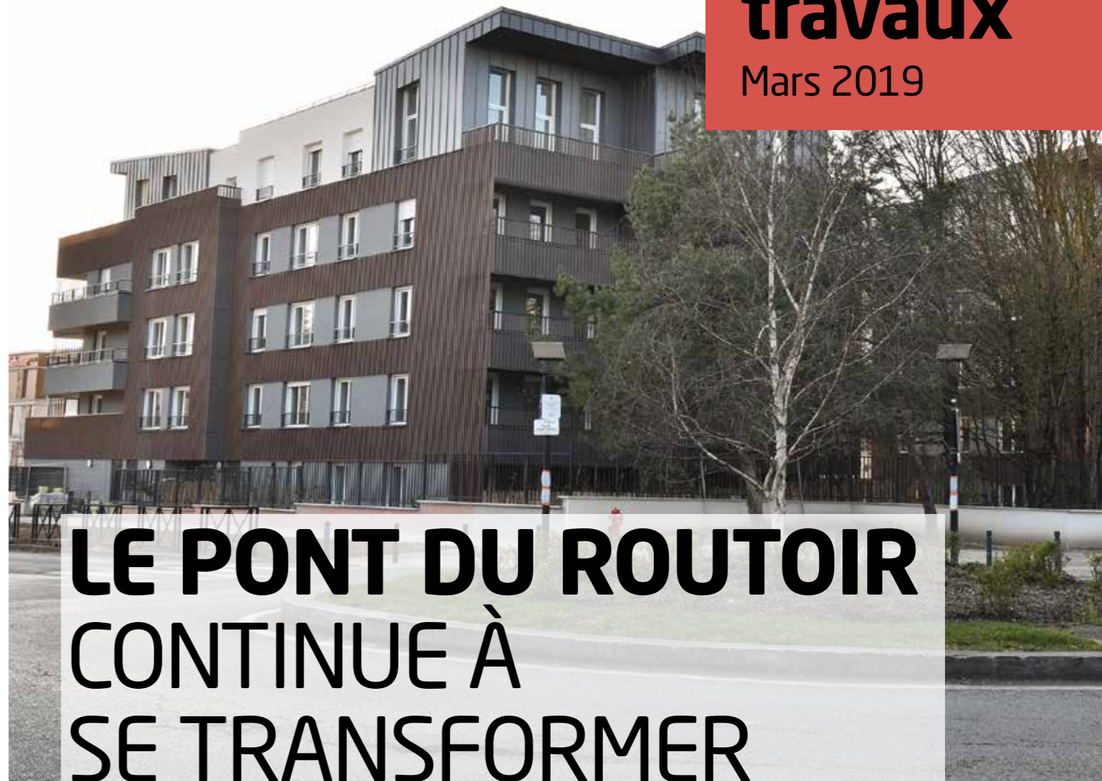
La résidence Oxygène

Réalisation et impression : Ville de Guyancourt