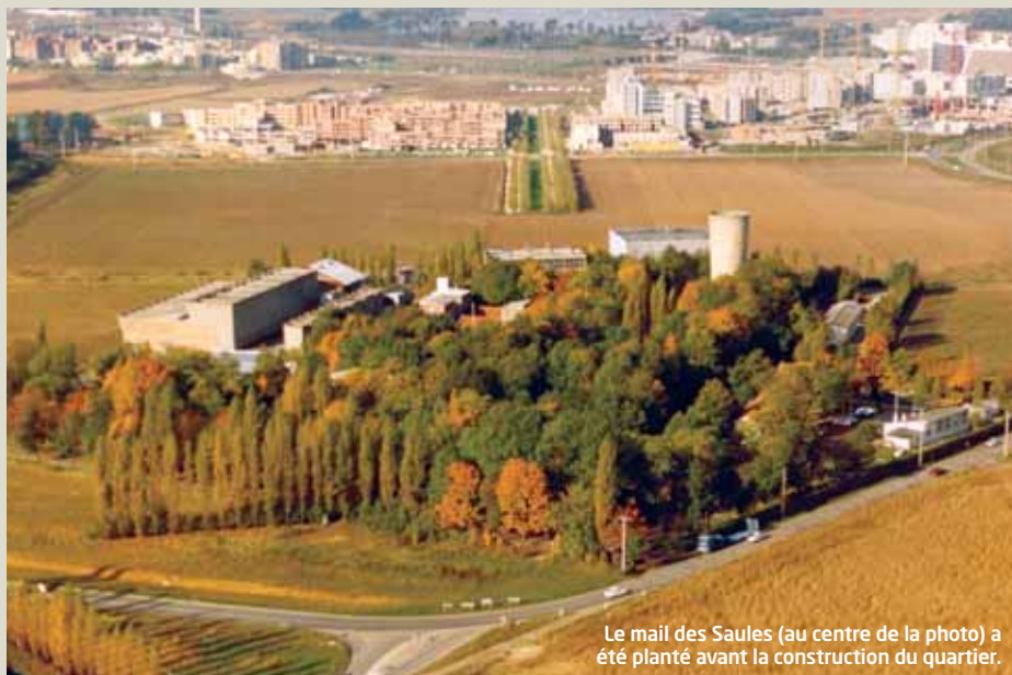
Le mail des Saules (au centre de la photo) a été planté avant la construction du quartier.

Il continuera à répondre aux autres usages du