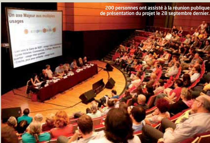
200 personnes ont assisté à la réunion publique de présentation du projet le 28 septembre dernier.