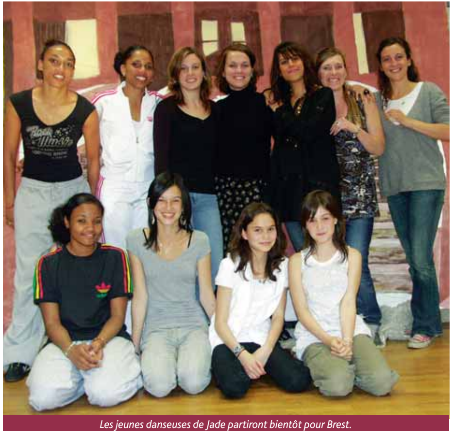
Les jeunes danseuses de Jade partiront bientôt pour Brest.

Dès sa création, l'atelier participe aux rencontres chorégraphiques sélectives proposées par la Fédération française de danse et se classe au niveau régional trois années de suite. Dopé par ces résultats, le groupe tente en 2004, avec L'Arbre à palabres , le concours national de danse de Gonfreville-l'Orcher et obtient le second prix. « L'apogée, un grand moment de bonheur » ! Un bonheur fugace, car la vie qui va (mariage, naissance d'un enfant, poursuite des études, engagements professionnels...) brise cet envol. Après plus de deux ans de pause, la chorégraphe reprend tout à zéro, ou presque. « J'ai proposé une audition aux élèves de l'association et reconstitué non plus un groupe chorégraphique, mais deux : adultes et ados. » La motivation est alors extrême. Deux nouvelles