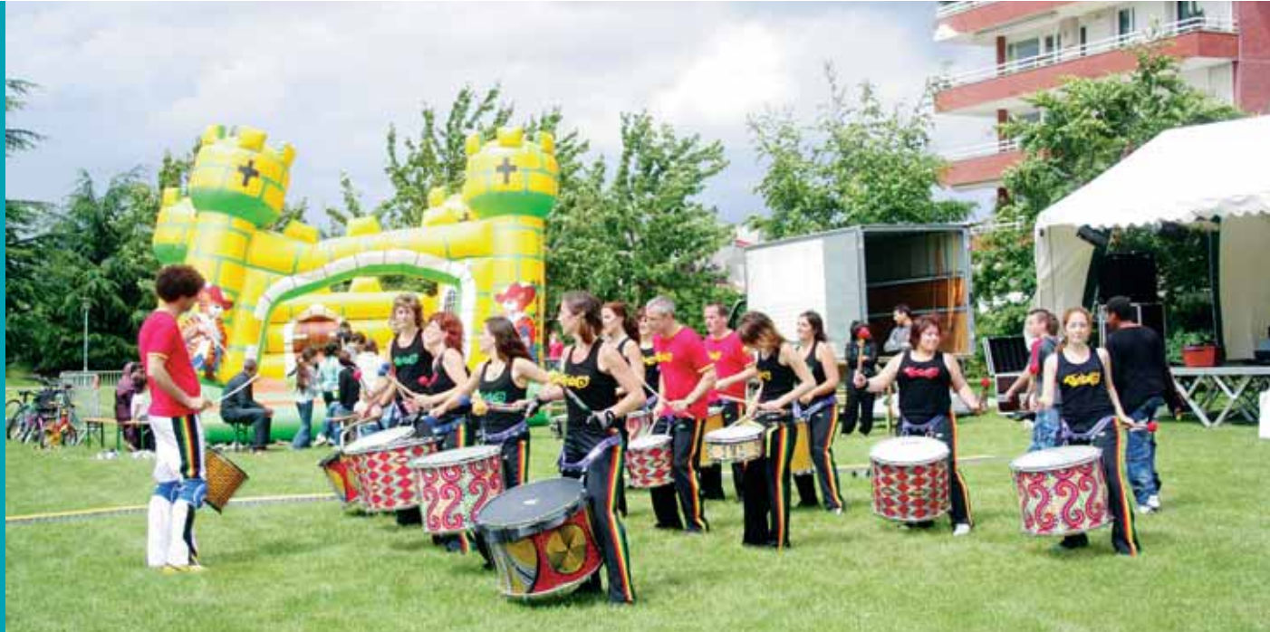
Les quartiers feront la fête en musique le 21 juin.

fond de course en sac par équipes (familles, - 10 ans et 10-18 ans). Un baby rodéo tannera les fessiers des petits, tandis qu'un taureau mécanique stimulera leur courage et qu'un ball-trap laser captivera les plus grands. Les stands maquillage, déguisements (ah ! les nattes indiennes !), photos trompe l'œil et tissage permettront aux plus sages de passer du bon temps. Côté folklore, les promeneurs en prendront plein les mirettes avec des danses country, préparées en amont lors de deux stages d'initiation gratuits donnés aux Guyancourtois par l'association les Talons sauvages, qui mènera d'ailleurs la danse. À défaut de murmurer à l'oreille des chevaux, DJ Tony Vegas (voir encadré) apprivoisera les tympanes des jeunes en faisant vibrer ses platines dans des « mix » classieux. Au programme également, des prestations scéniques M.A.O (musique assistée par ordinateur), et deux