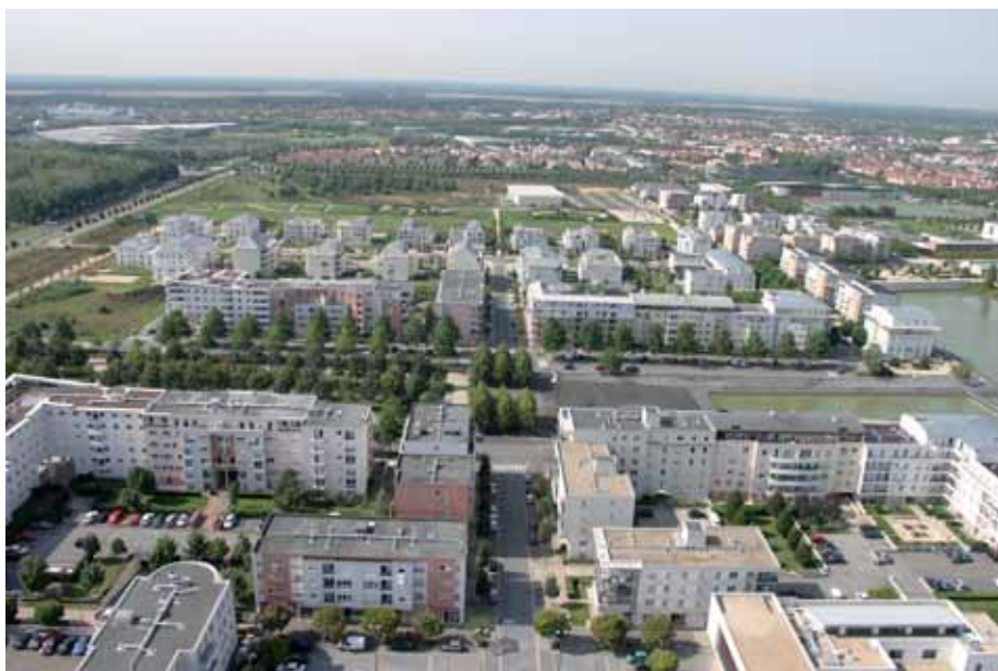
La future zone d'aménagement concerté de Villaroy entre dans le Plan Local d'Urbanisme.

Les élus seront amenés à se prononcer, au fil de l'élaboration du PLU, sur les orientations politiques envisagées pour l'avenir de notre commune. « Elles sont les mêmes que celles qui fondent le projet de ville », souligne le Maire. Nous voulons préserver et renforcer les grands équilibres qui font que Guyancourt est une ville où il fait bon grandir, étudier, vivre et travailler. Je veux parler de l'équilibre au niveau de l'habitat, en maintenant une offre diversifiée entre locatif aidé, accession aidée et accession libre ; de l'équilibre en termes d'habitat-emploi, en confortant l'attractivité et le développement économique de notre territoire, et enfin de l'équilibre entre les espaces bâtis et les espaces verts et bleus, en conservant une qualité de vie exceptionnelle en région