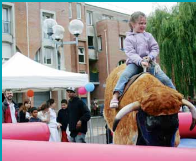
De nombreuses animations vous attendent.

trouveront aussi sur place des activités sur mesure à découvrir en solo comme en famille, pêche à la ligne, chamboule-tout, mur de photos musical, la main dans le sac et stand « fashion » (maquillage, coiffure...) pour les jeunes participantes les plus coquettes. Et si vous remportiez le gros lot en décodant l'énigme de l'après-midi ?