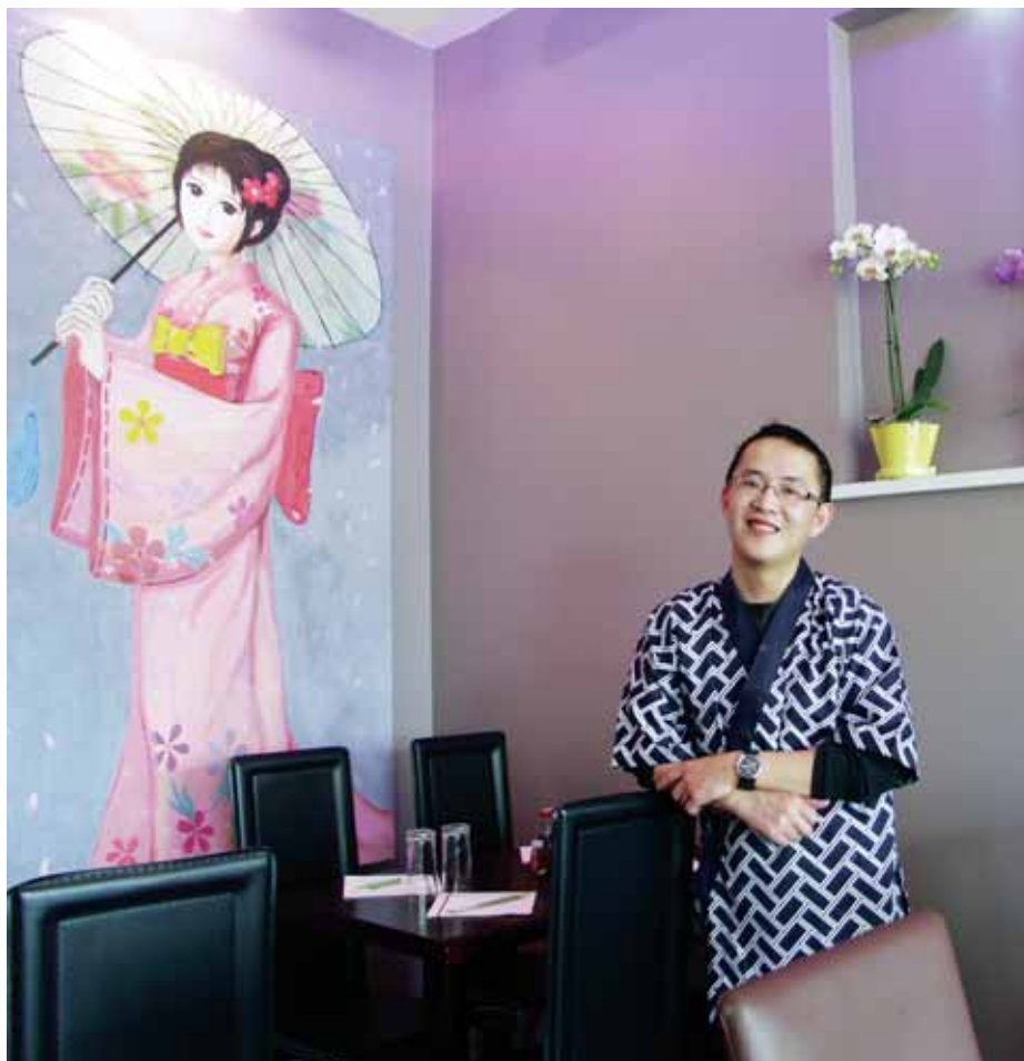
Le Kawai Sushi vous attend place Cendrillon.

Sans oublier... Kanazawa (restaurant japonais) 3, place Pierre-Bérégovoy (Villaroy) Tél. : 01 30 57 07 45