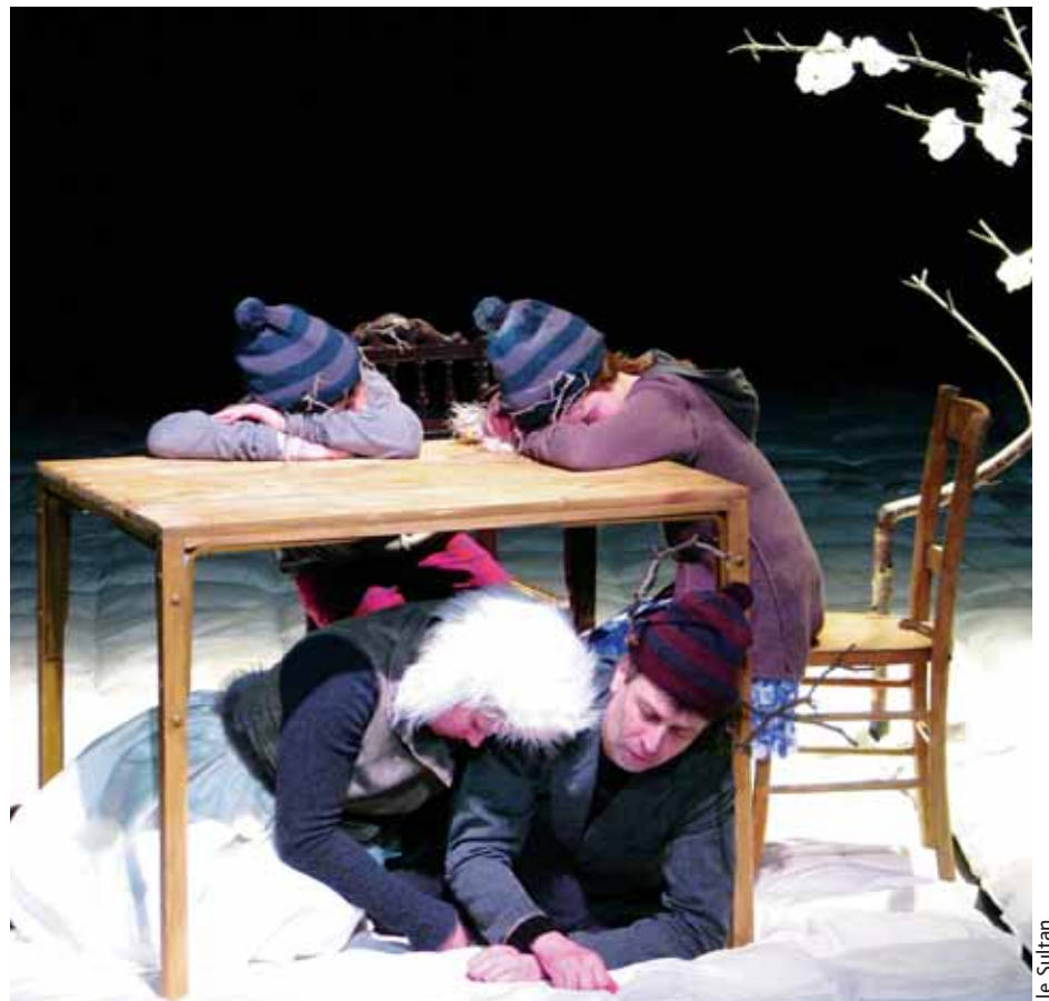
Le spectacle : « L'hiver, quatre chiens mordent mes pieds et mes mains ».