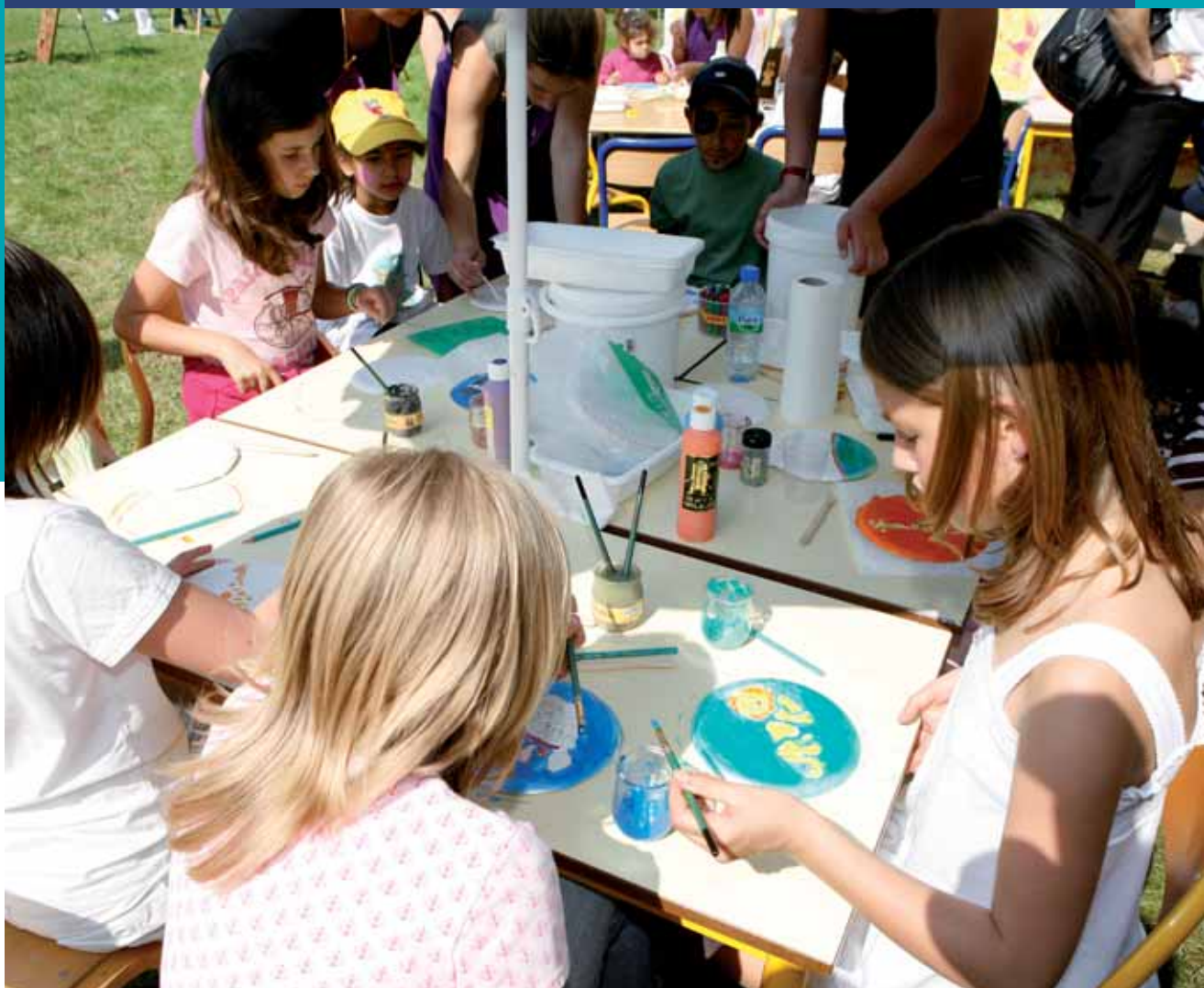
Les enfants ont rendez-vous pour une série de découvertes de fin mai à début juin.