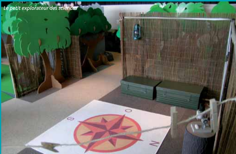
Le petit explorateur des sciences