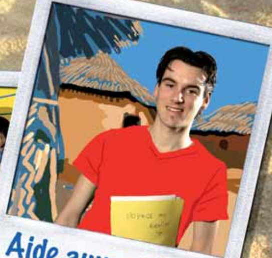
Aide aux projets