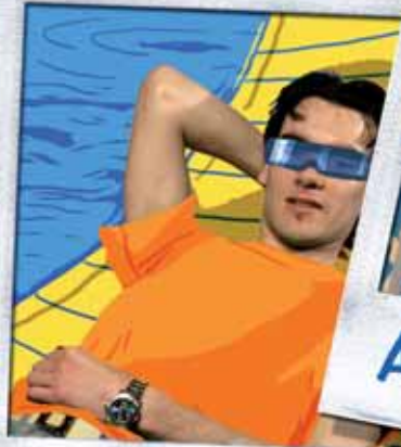
Loisirs - Vacances