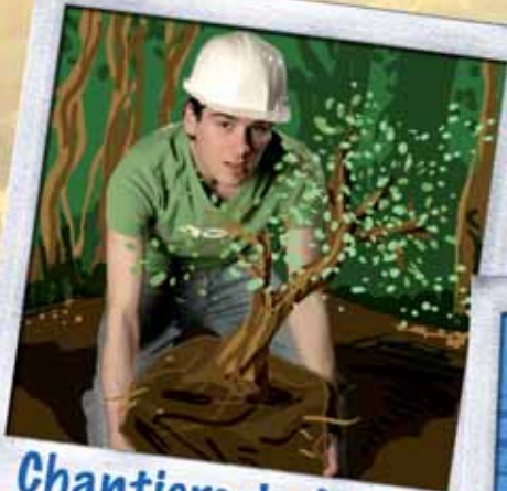
Chantiers de Jeunes Bénévoles