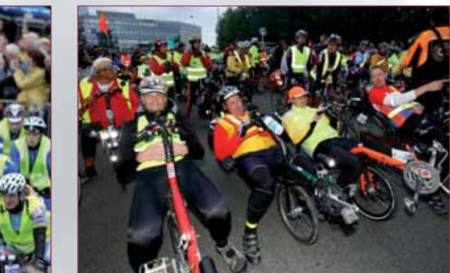
Départ des vélos spéciaux.