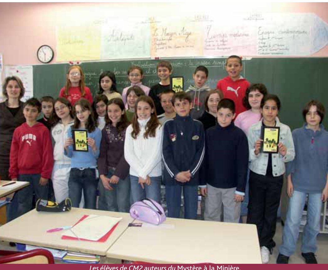
Les élèves de CM2 auteurs du Mystère à la Minière .