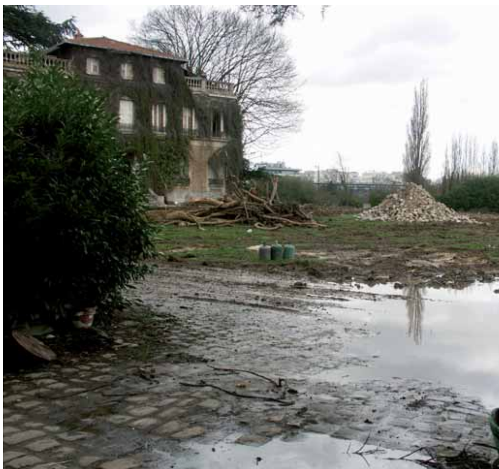
Les travaux ont débuté en mars.

Les travaux ont commencé en mars dernier par la démolition partielle des bâtiments (hangars agricoles) et le défrichage du terrain (30 000 m 2 de superficie totale), en préservant toutefois les plus beaux des arbres. D'une durée approximative de vingt-deux mois, le chantier prévoit à la fois la réhabilitation d'une partie des anciens bâtiments (sur 2 000 m 2 environ) et la construction de locaux (sur quelque 10 000 m 2 ). Inscrite dans le cadre du