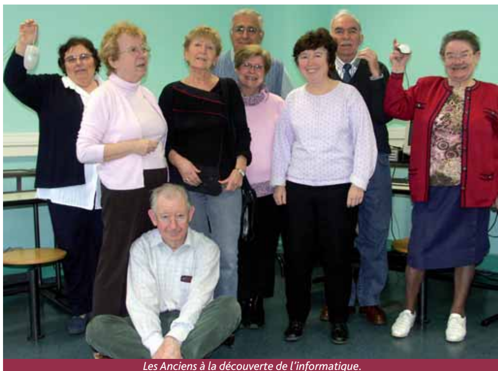
Les Anciens à la découverte de l'informatique.