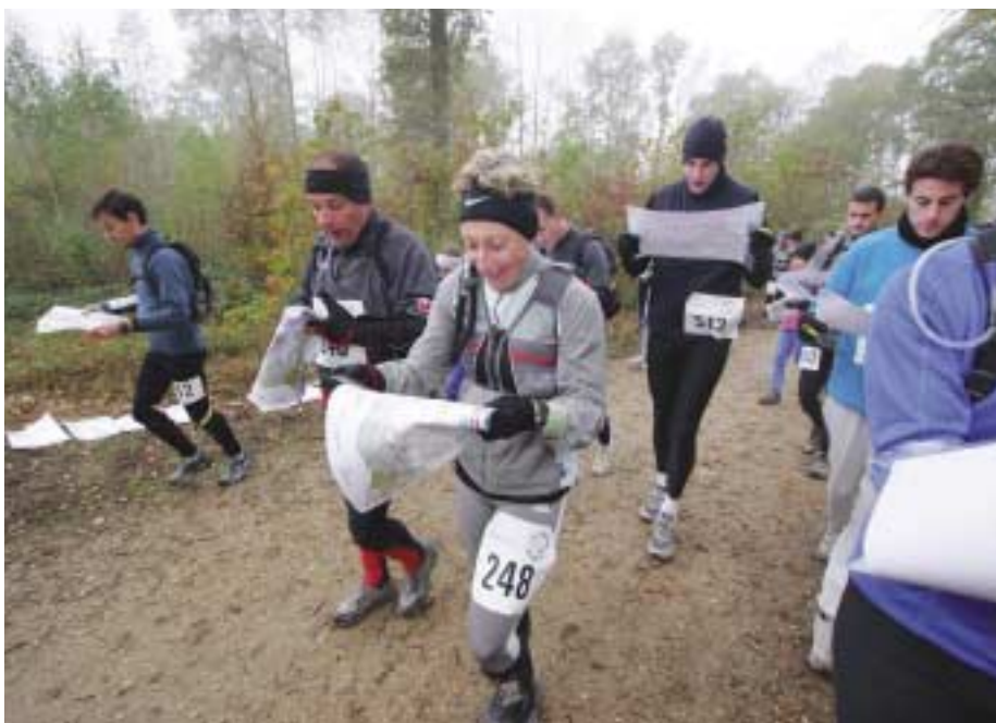
Tous les ans, Guyancourt Orientation 78 organise « O'Castor » dans la forêt de la Minière pour faire découvrir cette activité au plus grand nombre.

Faire les choses sérieusement sans se prendre au sérieux a permis à Guyancourt Orientation 78 d'évoluer au point de devenir une référence, tant au niveau des résultats collectifs qu'individuels. « Nous