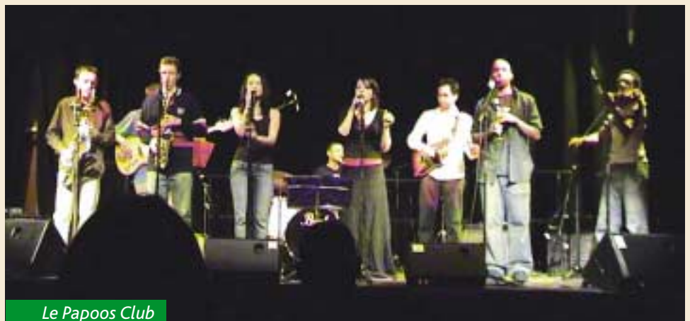
Le Papoo's Club