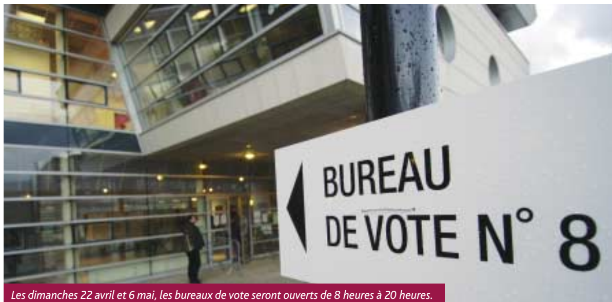
Les dimanches 22 avril et 6 mai, les bureaux de vote seront ouverts de 8 heures à 20 heures.

Seuls les électeurs qui appartiennent à l'une des catégories des bénéficiaires énumérés par la loi peuvent, sur leur demande, donner procuration de vote. Ils doivent pour cela se rendre soit au tribunal d'instance de Versailles, soit au commissariat de Guyancourt, où ils auront à