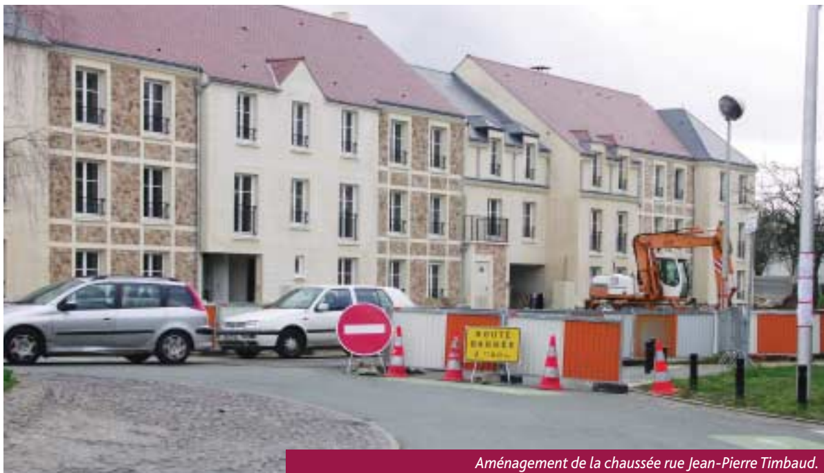
Aménagement de la chaussée rue Jean-Pierre Timbaud.

Travaux sur la route de Troux, vaste plan de réfection des couches de roulement programmé par la Communauté d'Agglomération en concertation avec la Ville... la voirie fera peau neuve pendant les vacances de printemps et d'été.