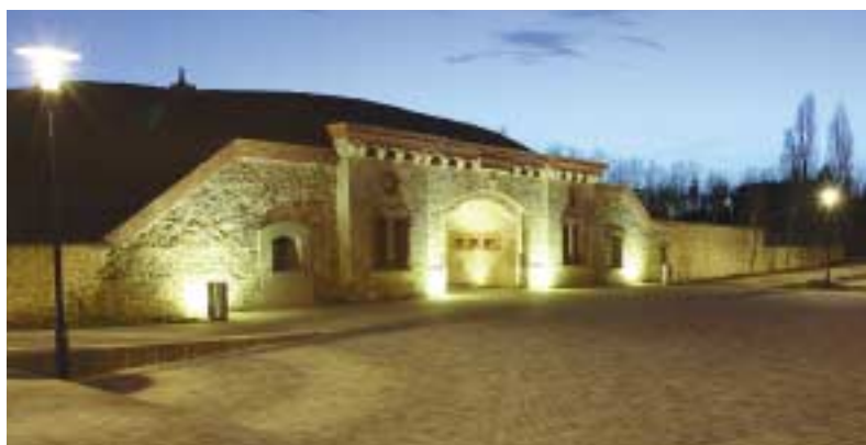
Guyancourt maintient ses taux d'imposition en 2007 et ouvre La Batterie, ainsi qu'un pôle multi-accueil pour les enfants (photo ci-contre).