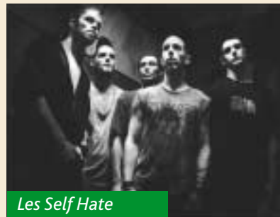
Les Self Hate

■ La Batterie, en coproduction avec l'association Kontshasso, nous invite, dans le cadre du Plateau 109 organisé par le CRY (Centre de Ressources Yvelinois pour la musique) et des off de La Tour, à faire plus ample connaissance avec trois groupes yvelinois. Le Papoo's Club , groupe de 10 musiciens qui répète au Local Musique de la ville, propose un répertoire qui mêle funk, world, jazz et musiques latines. Kandjar , groupe de 2 chanteurs soutenus par une formation basse-batterie-guitare-sampler, s'oriente vers un néo-métal qui se teinte de hardcore et de métalcore. Quant à Self Hate , nourri d'influences diverses mais résolument Métal, il déploie toute son énergie sur scène.