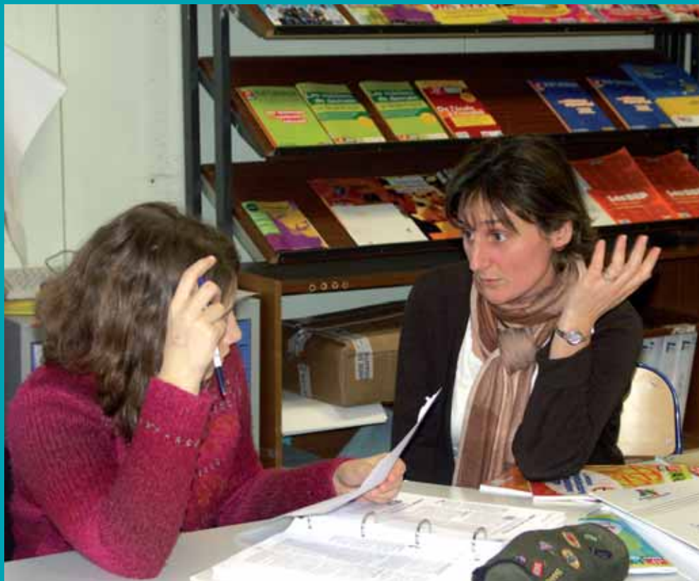
Les ateliers orientations du collège Paul-Éluard

Renseignements : Boutique Info Jeunes tél. : 01 30 48 33 99.