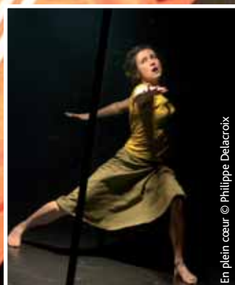
En plein cœur

Afin de lier la pratique à la découverte de spectacles, la participation à l'un ou à tous ces ateliers implique la prise d'un abonnement pour les quatre spectacles ( En plein cœur , Les Échappées , T'es trois et La Répétition ) au tarif préférentiel de : 24,50 € (plus de 26 ans) 18,50 € (moins de 26 ans) Renseignements et réservation auprès de Céline Cardon au 01 30 48 33 44.