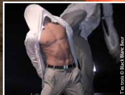
T'es trois