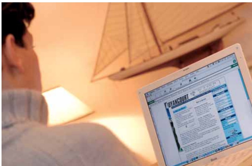
Après avoir changé d'aspect (image du haut), le site de la ville sera fonctionnel mi-février.

Avec une moyenne de 60 000 visites par an, le site internet de la Ville a trouvé sa place dans la vie quotidienne des Guyancourtois. D'un simple clic, l'internaute se retrouve sur une page d'accueil lisible et conviviale qui l'invite à naviguer au fil des rubriques. Il obtient ainsi un panorama complet et instructif, quels que soient ses préoccupations et ses centres d'intérêt du moment. Outre le moteur de recherche, les pages électroniques les plus fréquentées actuellement sont les actualités, les questions administratives, les sports, la culture, les services municipaux, les offres d'emploi, les transports et Guyancourt Magazine (en ligne). Quant à la lettre d'information, elle compte à ce jour 1150 abonnés, ravis de recevoir gratuitement à domicile, des nouvelles de leur ville et de ce qui s'y passe, dans tous les domaines.