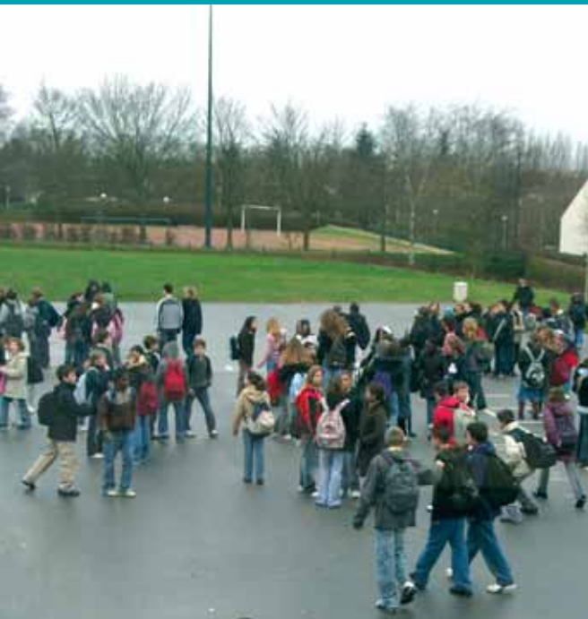
L'apprentissage est souvent la solution à l'échec de l'enseignement général.