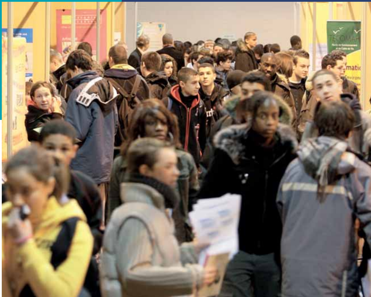
Les 9 et 10 février plusieurs centaines de jeunes sont attendus au Forum des formations aux métiers.