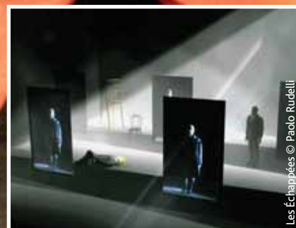
Les Échappées © Paolo Rudelli