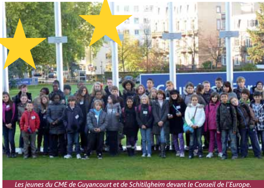
Les jeunes du CME de Guyancourt et de Schiltigheim devant le Conseil de l'Europe.