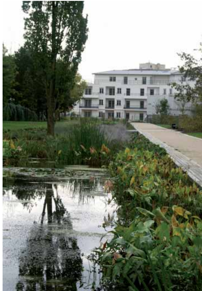
La municipalité va continuer de préserver les grands équilibres entre habitat et environnement.

F. D. : Une ville est une matière vivante, pas seulement une entité administrative. Toujours en mouvement et soumise à de multiples turbulences, elle est placée sous la responsabilité des élus qui en ont la charge. À Guyancourt, j'ai la chance d'être entouré, secondé et soutenu par des femmes et des hommes compétents et dévoués, dans les rangs de l'équipe politique choisie par les Guyancourtois, bien entendu, mais aussi au niveau des services municipaux. Avoir la certitude que tout le monde s'investit dans l'intérêt général donne une dimension supplémentaire aux actions, aux projets, une force qui incite à faire évoluer les choses, à anticiper pour aller plus loin, pour ne pas rester sur place. Sans folie des grandeurs, juste