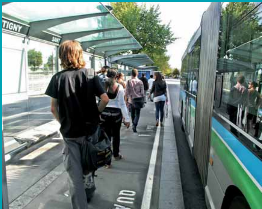
Transport en commun, actions en faveur de l'éducation,

nagement et d'urbanisme de la région de Paris (SDAURP), conduit par Paul Delouvrier à la demande de Charles de Gaulle. Objectif, éviter l'asphyxie de la capitale et l'expansion anarchique des banlieues en réorganisant la région parisienne de façon globale, via la création de huit villes nouvelles autour de la capitale. Ce qui suscita l'indignation d'élus et d'hommes politiques craignant de se voir imposer une croissance urbaine excessive sans aucun pouvoir d'intervention.