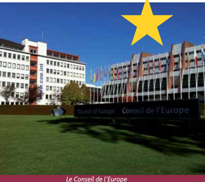
Le Conseil de l'Europe

(*) Institution indépendante de l'Union Européenne, le Conseil de l'Europe compte 47 pays membres, soit la quasi-totalité du continent européen. Son siège est à Strasbourg. Créé le 5 mai 1949 par 10 États fondateurs, le Conseil de l'Europe a pour objectif de favoriser en Europe un espace démocratique et juridique commun, organisé autour de la Convention européenne des Droits de l'Homme et d'autres textes de référence sur la protection de l'individu.