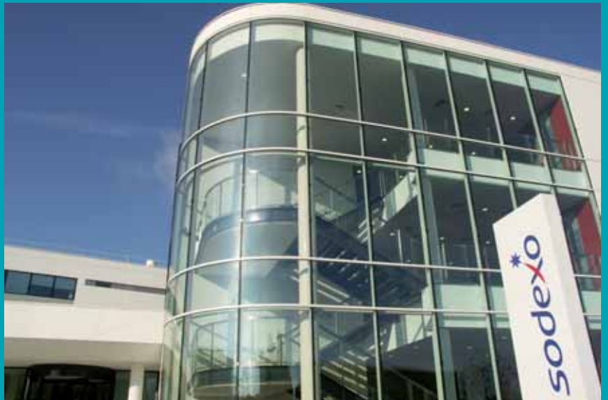
développement économique, aménagement et urbanisme : le champ des compétences de l'intercommunalité est vaste.

tés territoriales qui donne aux préfets la charge d'élaborer un schéma départemental de coopération intercommunale (SDCI), avec obligation que plus aucune commune de France ne se trouve hors d'une communauté de communes ou d'agglomération en 2014.