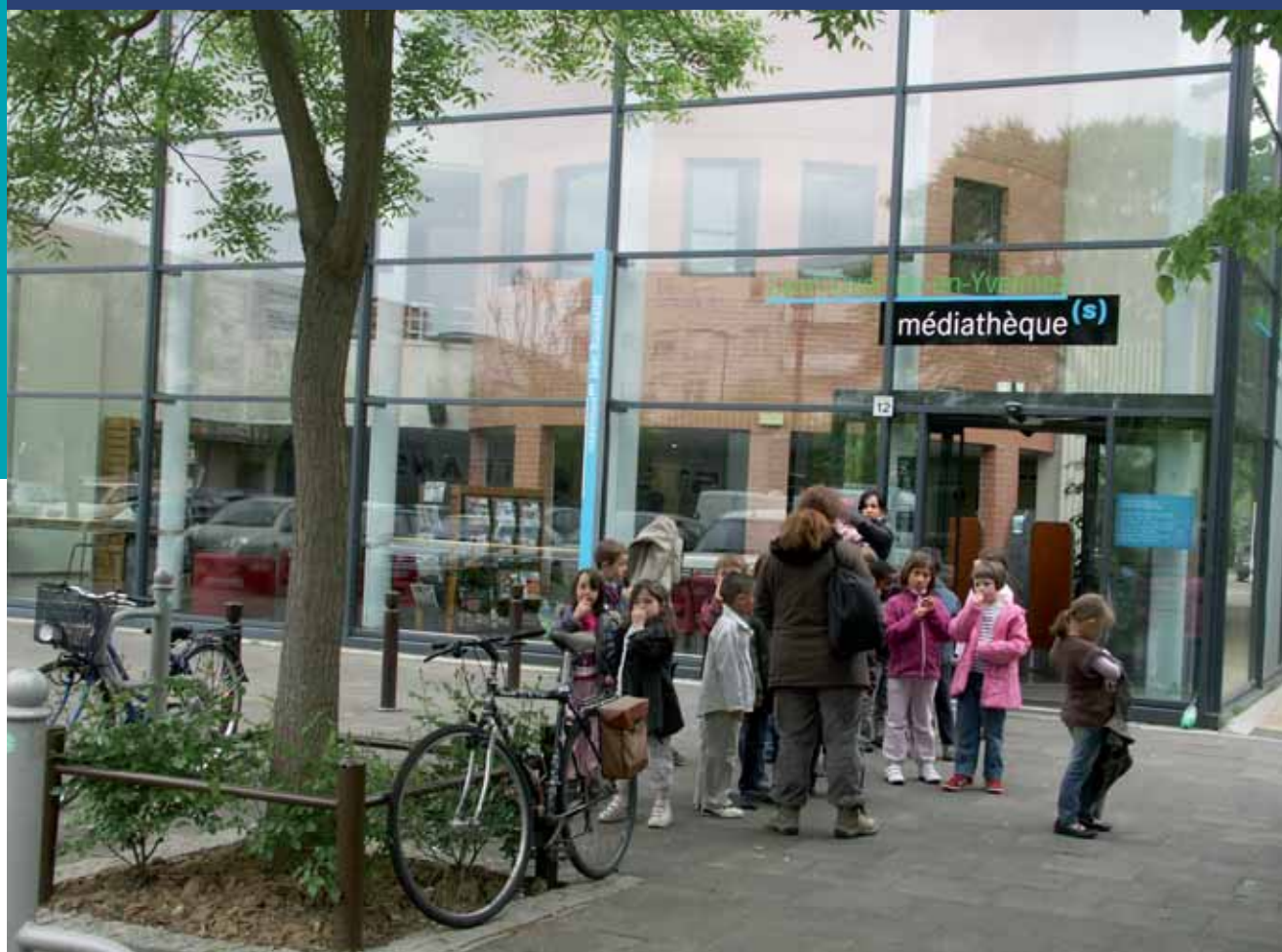
La Communauté d'agglomération gère des équipements culturels comme les médiathèques.