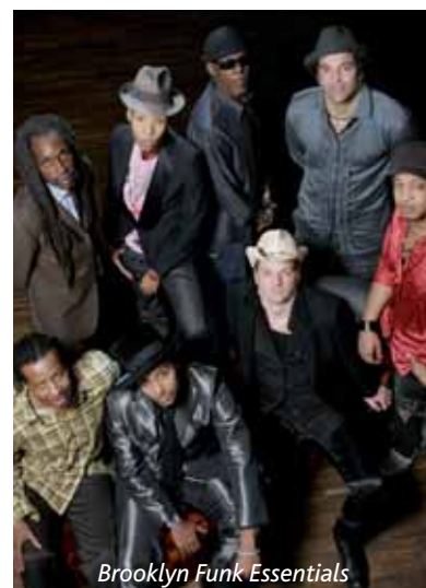
Brooklyn Funk Essentials

Vendredi 6 mai à 20 h 30 Tarifs : 18 €, 14 €, 15 € La Batterie Tél. : 01 39 30 45 90