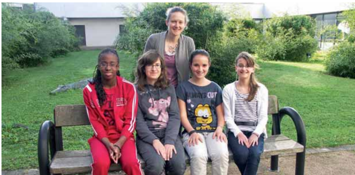
Les élèves de 5 e 2 du Collège Ariane ont découvert différents aspects de l'eau.