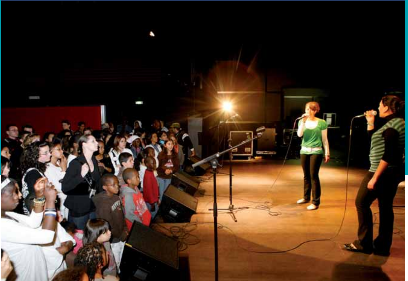
Les journées Jeunesse 2011 se conclueront par une soirée jeunes talents à La Batterie.