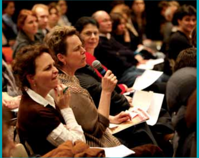
Deux rencontres sur l'adolescence, animées par des psychologues auront lieu. L'une pour les élèves du lycée de Vilaroy, l'autre pour les parents à la Maison de quartier Auguste-Renoir.

fessionnels chargés d'accompagner leur apprentissage et leur construction (enseignants, principaux, conseillers principaux d'éducation...) qui révèlent avec gaieté, force, émotion et gravité ce qui anime et préoccupe les adolescents, que l'on découvre alors souvent à l'opposé des stéréotypes véhiculés par les commentateurs patentés de notre société.