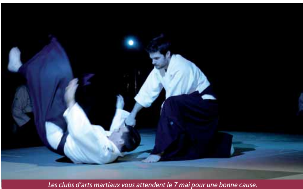
Les clubs d'arts martiaux vous attendent le 7 mai pour une bonne cause.

Si les quatre cent cinquante places du Pavillon Waldeck-Rousseau sont majoritairement occupées par les parents et amis de ces sportifs artistes d'un jour, on note toutefois la présence de Guyancourtois venus se faire une idée en côtoyant des disciplines différentes en vue d'une éventuelle inscription la saison prochaine. Au programme, plaisir et découverte à moindre coût, car le prix des billets est modique et sert une juste cause. La tradition veut en effet que la recette de la Nuit des arts martiaux soit intégralement reversée à une association caritative, qui sera cette fois CAP SAAA Saint-