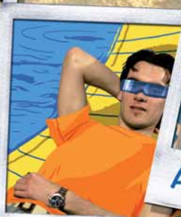
Loisirs - Vacances