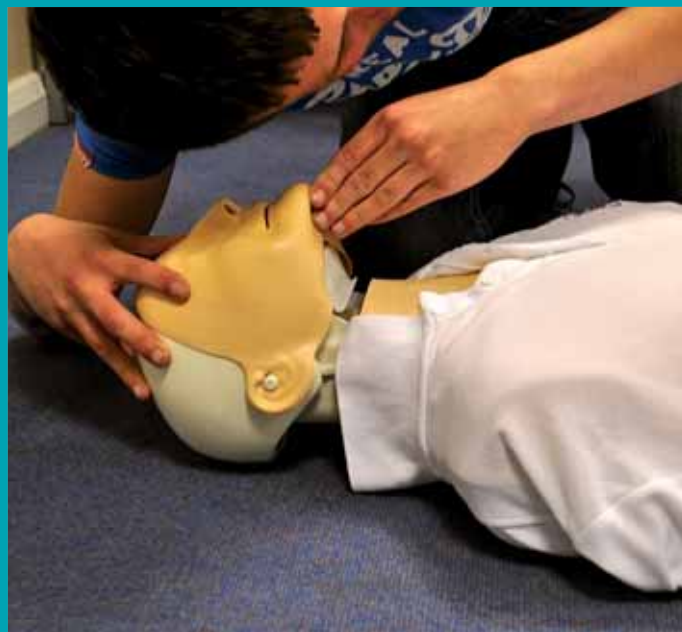
Les jeunes pourront apprendre les gestes qui sauvent.

en s'efforçant de les comprendre, sans ingérence ni démagogie, mais avec beaucoup de pédagogie.