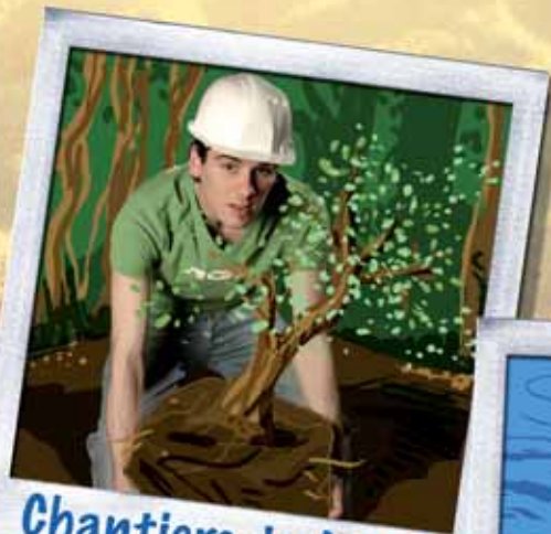
Chantiers de Jeunes Bénévoles