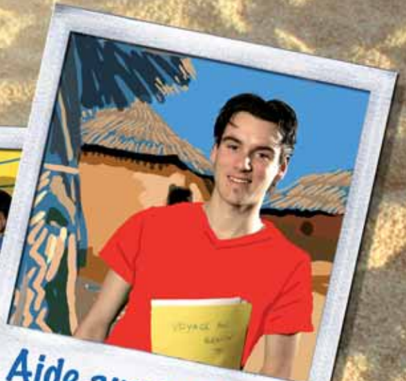
Aide aux projets