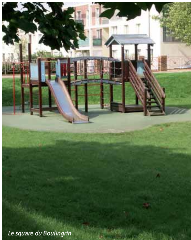
Le square du Boulingrin