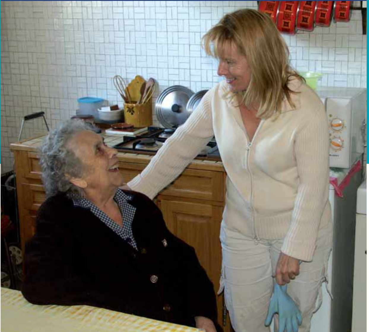
De l'aide à domicile à la télé-assistance, la Ville reste à l'écoute des plus âgés d'entre nous.