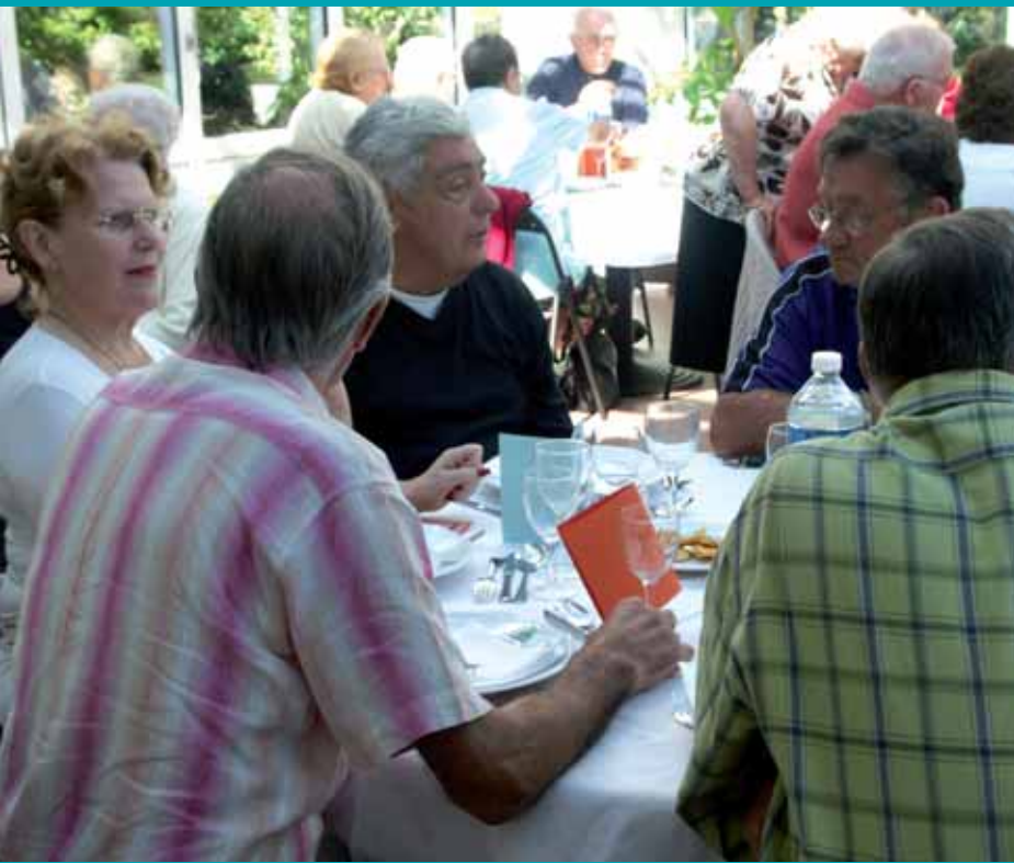
Une fois par mois, les Anciens ont l'occasion de se retrouver autour d'un repas.