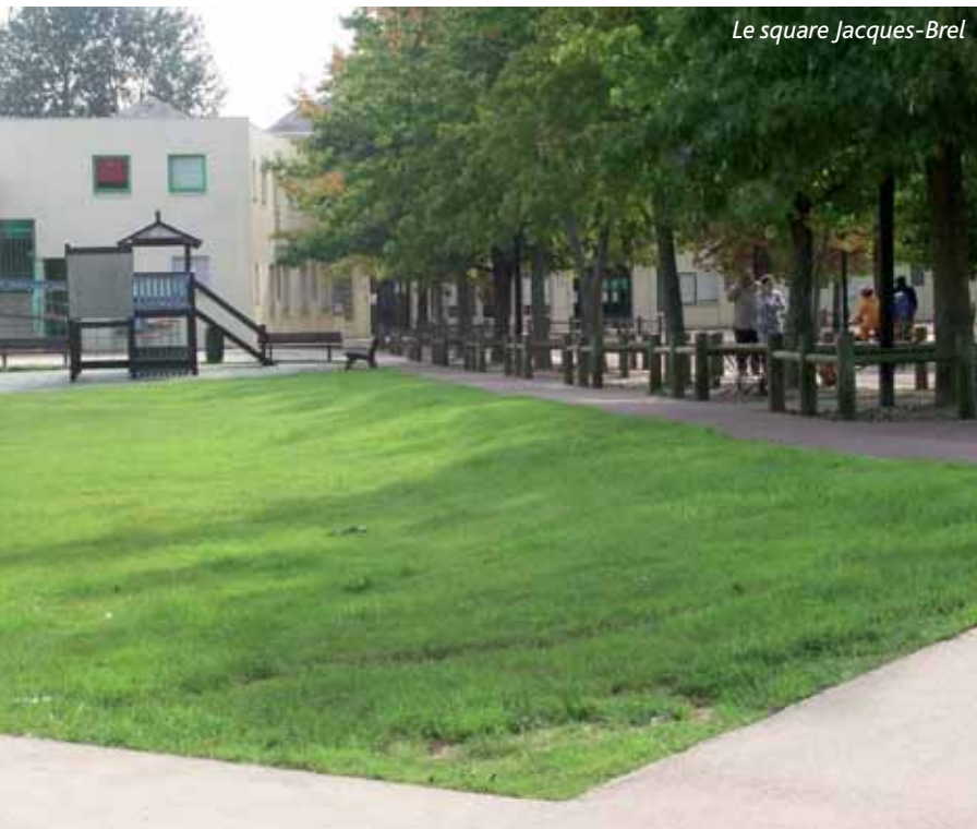
Le square Jacques-Brel

« Très en vogue au XVII e siècle, ces sortes de greens accueillait à l'époque les jeux de boules. » D'ici au printemps prochain, un alignement de tulipiers de Virginie ceinturera la partie haute, des arbustes à fleurs agrémenteront le paysage et une nouvelle aire de jeux clôturée sera réalisée. On y accèdera par un escalier. Une rampe pour personnes handicapées sera réalisée en partie basse. « Les enfants trouveront là, sur sol souple, un jeu sur ressort en solo, un jeu sur ressort à plusieurs, une cabane toboggan et une structure pour adolescents. Quant aux amateurs de jeux de ballon, ils disposeront à leur guise et en toute liberté du reste du terrain. » Coût de l'opération : 184 700 €. Accès au chantier par la rue Henri-Matisse, avec restriction de stationnement le long de cette voie durant les travaux. ■