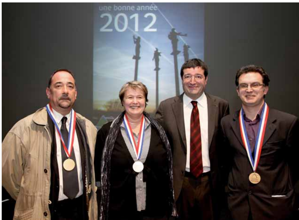
Les médaillés de la Ville en compagnie du Maire lors de la cérémonie des vœux 2012.

neur de Guyancourt Handball, il a récemment remplacé au pied levé un entraîneur blessé et ne devrait pas tarder à reprendre du service auprès de ceux que cet homme de caractère appelle « ses » gamins.