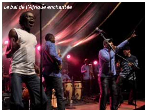
Le bal de l'Afrique enchantée