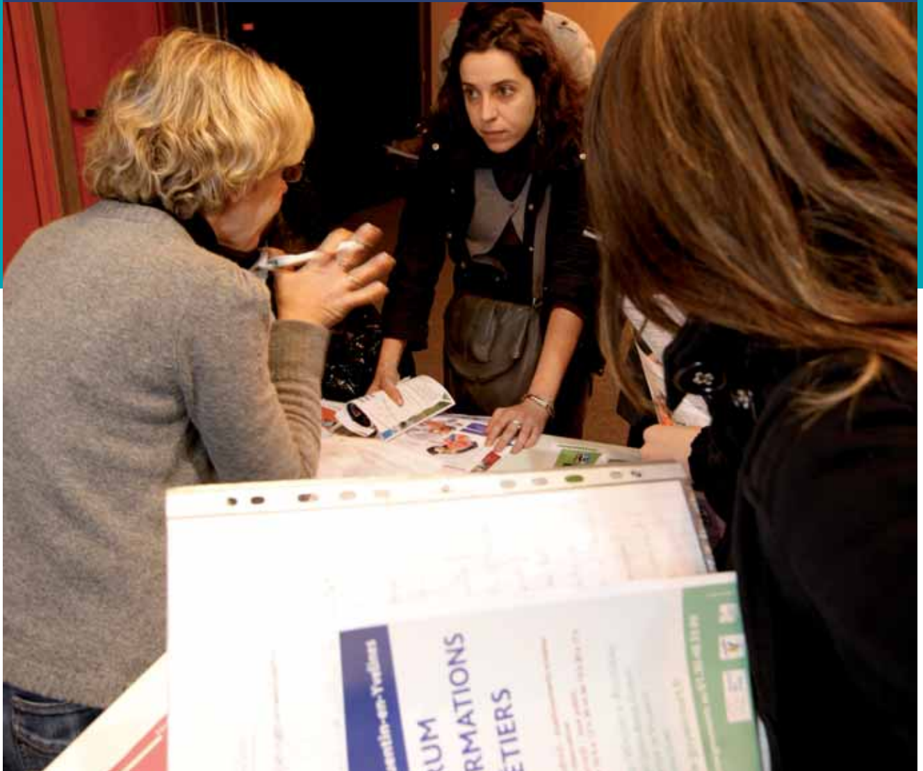
Le forum des formations aux métiers permet aux jeunes de mieux s'orienter.