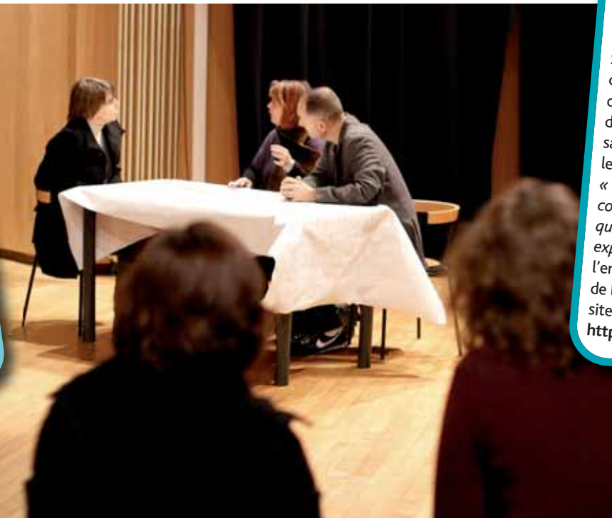
Le théâtre débat de l'École des parents de Guyancourt.

de surprise, lui qui se fermait comme une huître dès que nous parlions formation à la maison s'est bien débrouillé au Forum, a préparé et posé ses questions tout seul, et décidé qu'il deviendrait électricien. Étonnés qu'il veuille y retourner dès le samedi matin, nous n'aurions jamais pensé qu'il ferait un choix aussi rapide et aussi juste pour son avenir. »