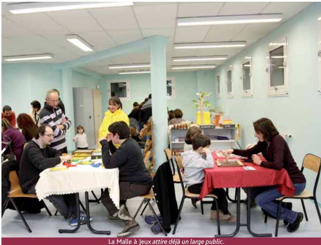
La Malle à Jeux attire déjà un large public.

Mais revenons à la Maison de quartier Auguste-Renoir, où La Malle à jeux rassemble les mercredis et samedis après-midi des joueurs enthousiastes. « La curiosité est là, reste maintenant à affiner l'offre en fonction de la demande, à trouver des jeux fédérateurs qui correspondent aux attentes des différents profils de joueurs, à faire évoluer ce nouvel espace, notamment en proposant des soirées thématiques ciblant des publics spécifiques une soirée par