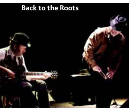
Back to the Roots