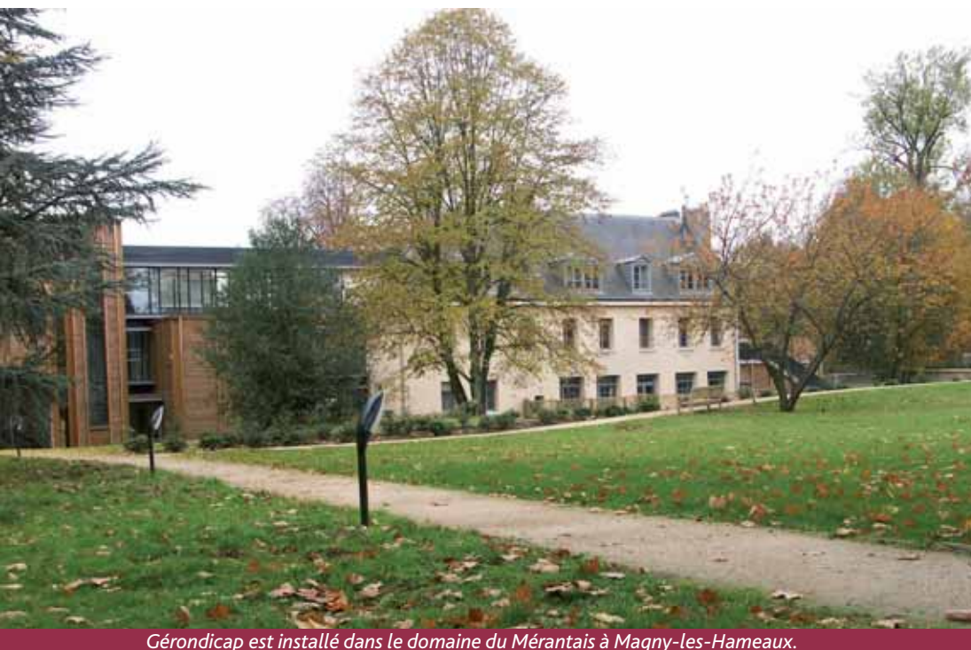
Gérondicap est installé dans le domaine du Mérantais à Magny-les-Hameaux.

Financés par le Conseil général des Yvelines dans le cadre de ses missions en direction des personnes âgées et handicapées (en complément de la Caisse nationale de solidarité pour l'autonomie et de l'Agence nationale de santé), ces dispositifs ont le soutien de plusieurs partenaires et mécènes. Groupe Pfizer, Hôpital de Plaisir, Lions club Montigny les 3 Villages, association La Rencontre, Association insertion, éducation, soins, association France Alzheimer, La vitrine médicale, Groupe Malakoff Médéric, Communauté d'agglomération... sans l'appui desquels ce grand pas en avant en matière de santé publique de proximité n'aurait pu être franchi.